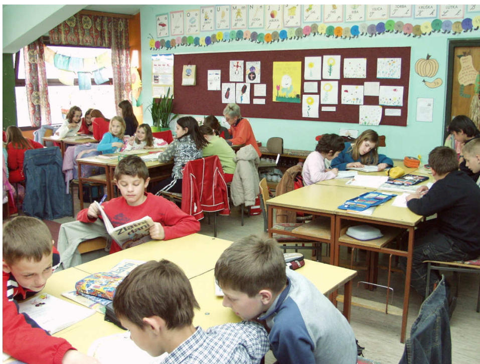
Suradničko učenje u projektu «Korak po korak»

Veliku važnost ima i rad na stvaranju zajedništva u grupi. Tome mogu doprinijeti slijedeći postupci: